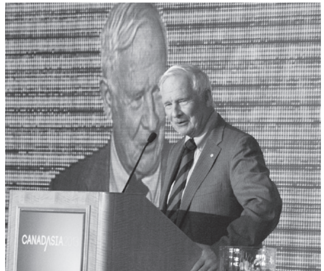
加拿大 David Johnston 總督