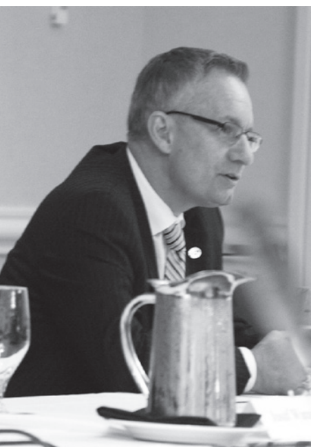
加拿大國際貿易暨亞太路徑部 Edward Fast 部長