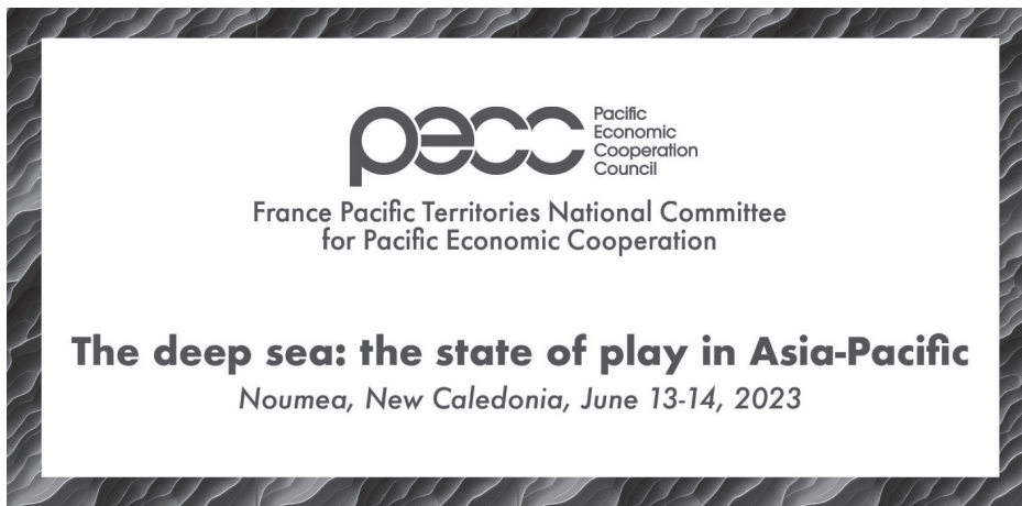
太平洋經濟合作理事會法屬太平洋群島委員會（FPTPEC）主辦國際研討會探討海洋議題。

海洋生態多樣性，或是海洋汙染相關會議等，邀請具有生物學背景、海洋物理學背景或社會科學背景的專家參與，共同就目前國際間海洋相關熱門議題進行討論，有助於未來推動亞太、印太地區海洋永續發展的工作。■