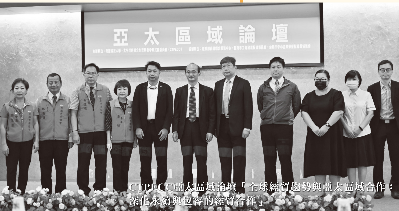
CTPECC亞太區域論壇「全球經貿趨勢與亞太區域合作：深化永續與包容的經貿合作」