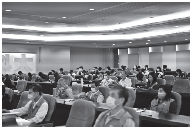
南臺科技大學學生、臺南市工商發展投資策進會與中小企業榮譽指導員協進會成員。

而針對受淨零轉型影響的脆弱族群與勞工，在我國推出的《氣候變遷因應法》、「十二項關鍵戰略」與「臺灣 2050 淨零排放路徑」中皆有相關說明。另外 APEC 場域中亦有「公正能源轉型」倡議的討論，以期在淨零轉型的過程中，結合「永續」與「包容」。透過本次論壇互動，本會認為我國可再強化碳盤查宣導與技術支持，透過實作與數據引導製造業與農牧業投入轉型，並持續於 APEC 場域與其他會員經濟體交流。■